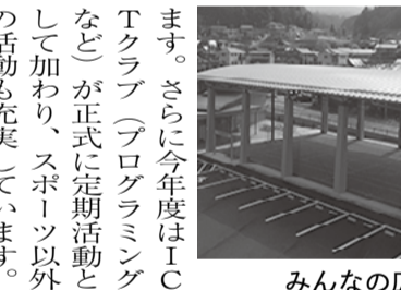
みんなの広場アスポ

「みんなの広場アスポ」を拠点に活動するたかぎスポーツクラブ。今年度で設立八年目を迎えています。昨年度の会員数は、再び過去最高を更新する五六五名となり、これまでにないほど多くの方がクラブに参加しました。今年度は五月まで、新型コロナウイルス感染拡大防止の為に活動を休止しておりましたが、六月からは感染症に気を付けながら活動を行っており、子どもから大人まで、元気な声