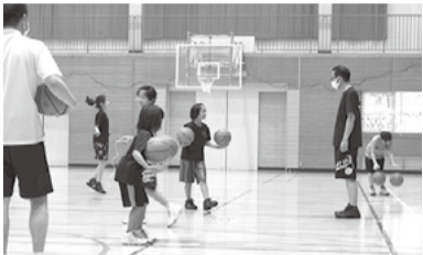
喬木ミニバスケットボールクラブ