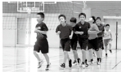
喬木ジュニアバレーボールクラブ