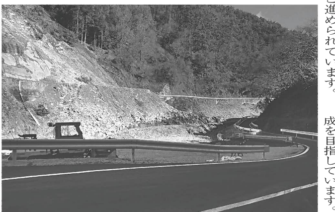
加々須災害復旧現場