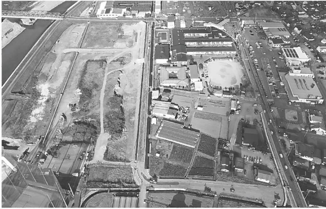
堰下ガイドウェイヤード

国道大島阿鼻線加々須地籍の迂回路 昨年七月の集中豪雨により、加々須地籍で崩れが起こって道路が通れなくなりました。現在は加賀須川を渡る迂回路が造られ、通行できるところになっています。復旧工事は令和四年度中の完成を目指しています。