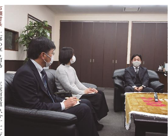
市瀬村長 工事の車も阿島橋側から入つて小川側に出るついでにワンウェイで、往復はさせないんですよ。ガイドウェイ完成後の通過台数は、厳密に例えは一〇分間に一台とか決められているので、想定しているような車は走らないで、いつトラックが通つたかということになると思ひますが、現在は土を運んでいるので、結構頻りに行きあつと思ひますが、造成工事の伊久間の方については三月に終わつちゃう予定ですが、工場団地に堰下ガイドウェイ、道路新設、リニアの本線の瀬替え工事が入つてくるので、今は全部重なるやつだったので、大変なんです。落ち着けばガイドウェイといつて、リニアの coils を作る工場なんですけれども、一日に十何台のペースなので、ただ車は大きくなりますけれども、多分渋滞は解消されると思つています。今年一気に動きますので、楽しみに見ていければと思います。

市瀬村長 保育園には今度展望台も作ると思つていますが、とても景色のいい地籍になりますので、大人になつて二回外に出て、友達にこんな良いところで僕たちは保育園時代を過ごしたんだよという案内ができるような施設にしたいと、ちよつと気合いを入れてやりたいと思つています。