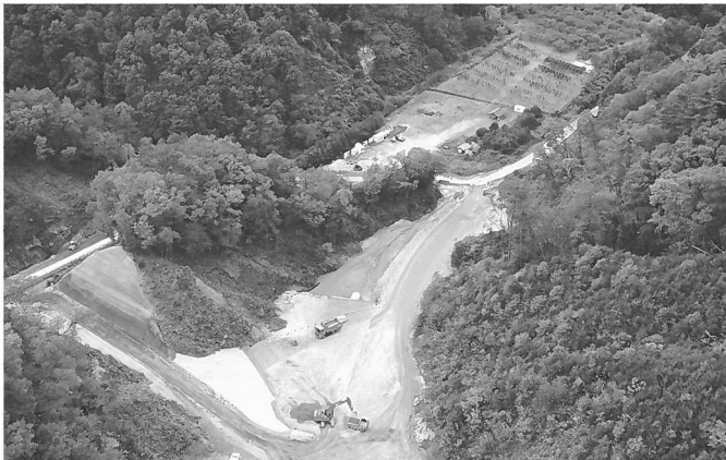
三遠南信自動車道 雨沢