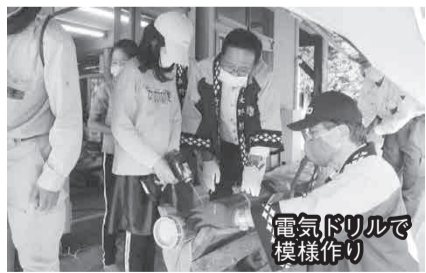
電気ドリルで電機模様作り

十月十一日 学遊館で子供たちが竹灯籠作りを行いました。十一月十日から阿島区主催の、村文化財の曙月庵のライトアップに使用するので、今回共同で行って、みんなに元気を与えられるようにと企画されました。