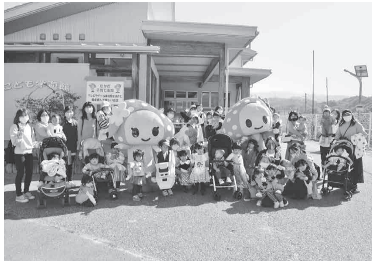
素敵に衣装した子ども達、ベリー&ゴーと一緒にパチリ☆

十月三十日(金)、こども学遊館の「遊びのひろば」では、未就園児の親子がハロウィンを楽しみました。今年も新型コロナウイルス感染症の影響で内容はいつもと異なりましたが、可愛