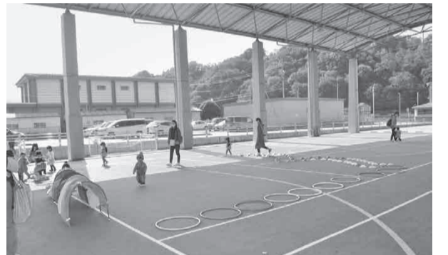
アスボでしっかりサーキット遊びができました

十月三十日(金)、こども学遊館の「遊びのひろば」では、未就園児の親子がハロウィンを楽しみました。今年も新型コロナウイルス感染症の影響で内容はいつもと異なりましたが、可愛