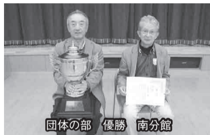
団体の部 優勝 南分館

第二十五回村民ゴルフ大会が十月二十一日(水)、高森カントリークラブで開催されました。今回は南分館が当番幹事で行われ、大会には合計で十三分館一〇二名が参加しました。なお今年も新型コロナウイルス感染症対策のため、開会式および表彰式の参加人数を少なくする、全体の慰