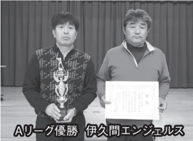
Aリーグ優勝 伊久間エンジェルス