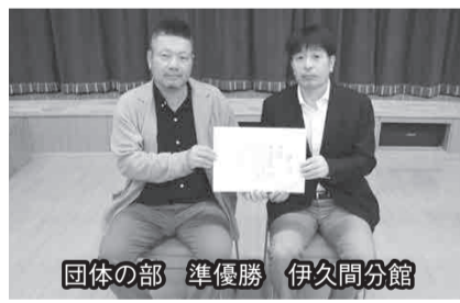
団体の部 準優勝 伊久間分館

成績は次の通りです。入賞された方はおめでとうございます。また参加された方は大変お疲れ様でした。