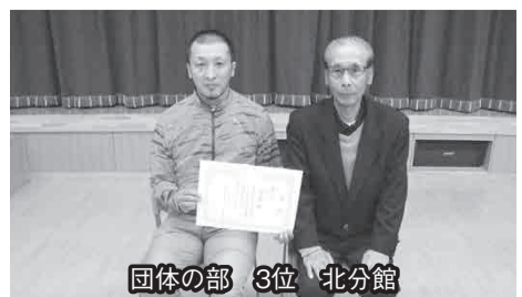
団体の部 3位 北分館