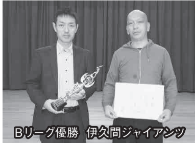
Bリーグ優勝 伊久間ジャイアンツ

十一月四日、福祉センターで令和二年度夜間ソフトボール連盟の閉会式が行われました。本年度は、新型コロナウイルスの影響で開催が危ぶまれましたが、通常のリーグ戦を二リーグ制に変更して行うことができました。今年度の閉会式は感染症予防のため、各チーム二名ずつの参加で懇親会は省略されました。羽生国分会長あいさつに続いて、各リーグの優勝、準優勝チームに表彰されました。