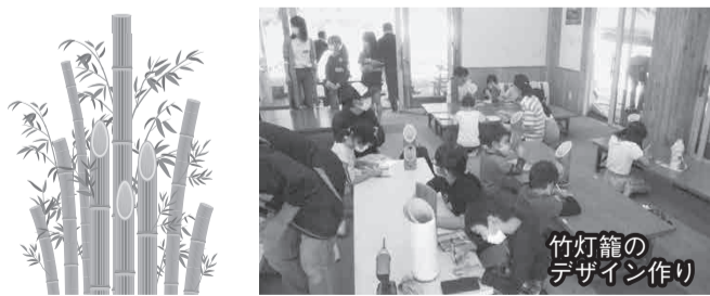
竹灯籠のデザイン作り

今年度は新型コロナウイルスの影響で、阿島区、学遊館では行事が行えなかつたので、今回共同で行って、みんなに元気を与えられるようにと企画されました。また、阿島区では北保育園や各自治会でも竹灯籠作り、当日は二〇〇個を飾ります。十一月十日から二十二日までの夜六時から八時まで曙月庵をライトアップしますので、是非ご覧ください。