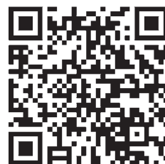
美馬市立図書館 美馬の記憶アーカイブ 郷土資料