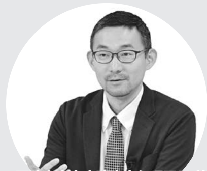
諏訪赤十字病院臨床心理課長 兼 国際赤十字心のケア登録専門家

講演は感染流行状況により、延期またはリモートとなる場合があります。予めご了承ください。