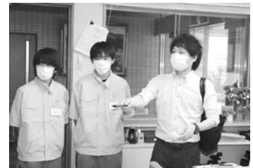
【写真右】アイテックの方から話を聞く中学生

喬木中学校の2年生が職場体験に行きました。実際にそれぞれ職場に行き、社員の一員となり仕事の厳しさや楽しさを体験していました。