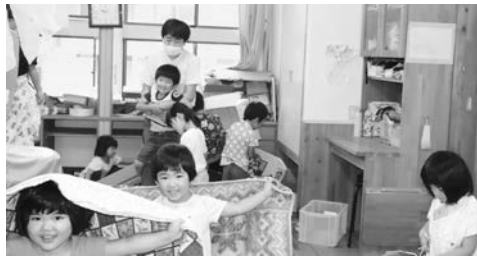
【写真右】図書館で保育園に貸し出す絵本を届けに来てくれました。絵本が揃っているか確認。