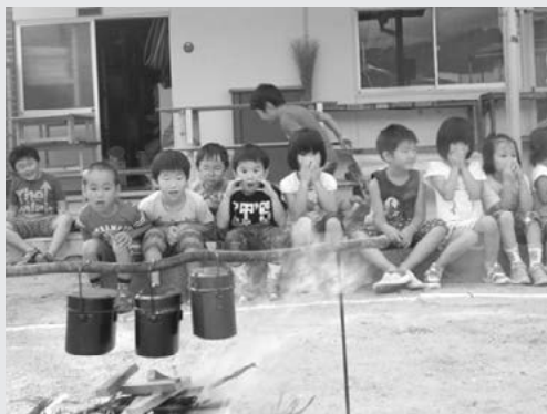
年長児飯ごう炊さん 「美味しいご飯になーれ」