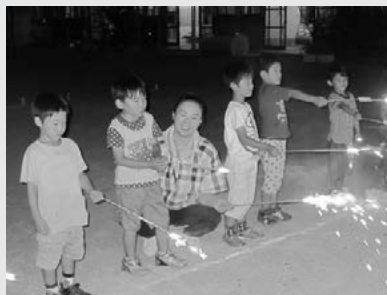
「いろんないろで きれいな花火だね」