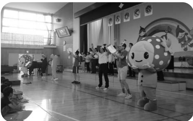
ベリー&ゴーも出演しました