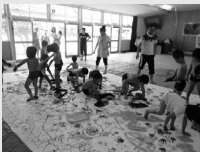
クレヨンとえのぐで、 夜空を作りました 「大きな宇宙ができたよ！」