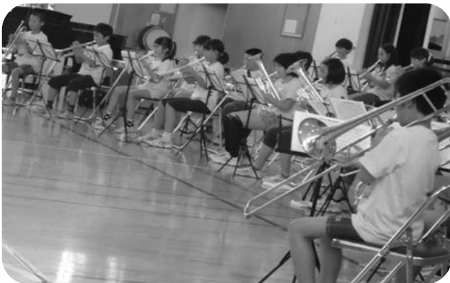
金管バンドも活躍しました