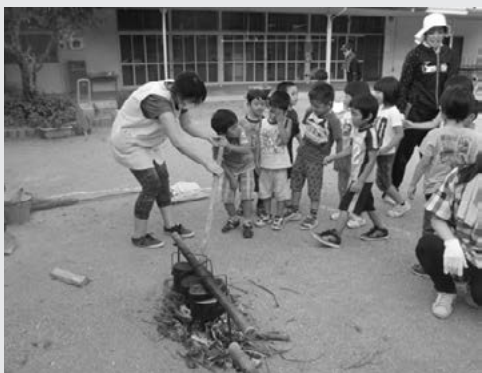
「飯盒の中でご飯がグツグツ踊ってるよ」