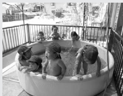
プール 「気持ちいいよ〜」