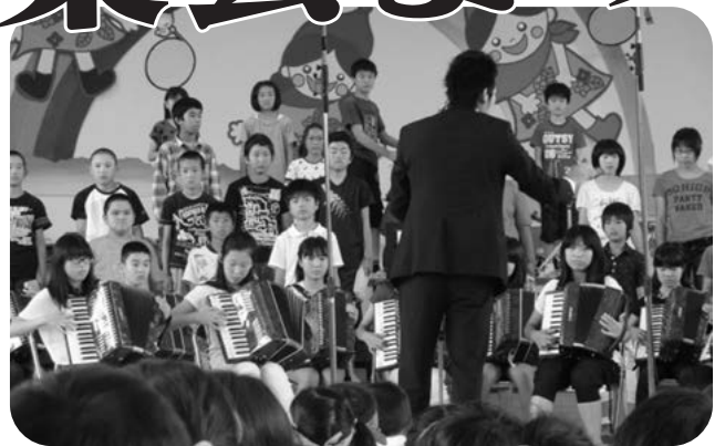
6年生 さすがの演奏です