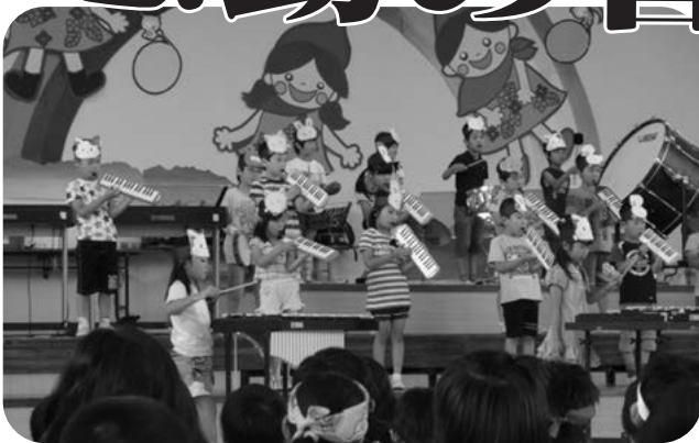
リズムに合わせて 鍵盤ハーモニカ