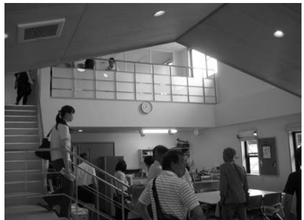
↑辰野町 世代間交流センター茶の間

7月14日、辰野町ボランティアセンター・世代間交流センター茶の間と高森町ボランティアセンターの視察に準備委員会のメンバーを含めた21名が参加され、立ち上げの経緯や現在の課題等をお聞きしました。百聞は一見にしかず、と実際のセンターを見ることでイメージが膨らみましたが、より目的を明確にし高木村らしいセンター開設に向けて話し合うことが必要だと実感しました。今後は今までの意見をまとめるための準備委員会が開催されます。