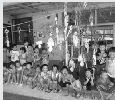
「お願いが七夕様に 届きますように」