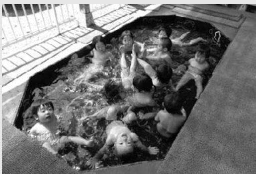
プール気持ちいいなー！（未満児）