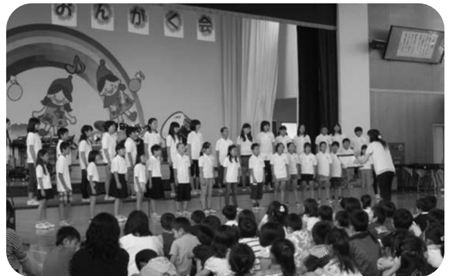
合唱部もコンクールに向けてがんばります