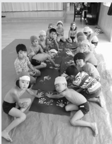
おほしさまをいっぱい作ったよ