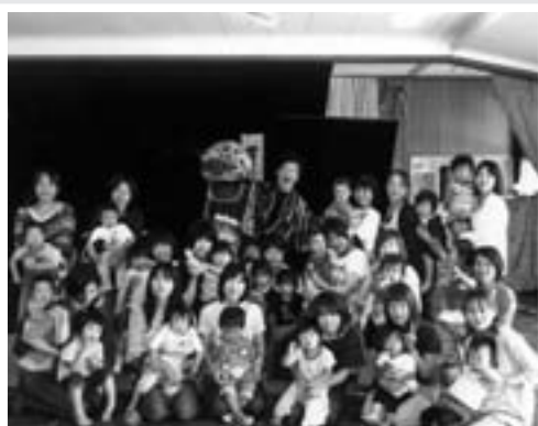
北保育園 たんぼぼクラブ