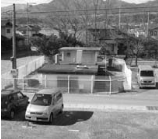
アセス実施区域内の村営水道堰下水源

編集 企画財政課／発行 喬木村役場 TEL 0265-33-2001 FAX 0265-33-3679 印刷 龍共印刷株式会社 (飯田市上郷黒田121-1)