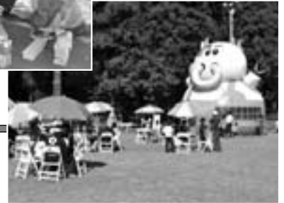
芝グランドの様子