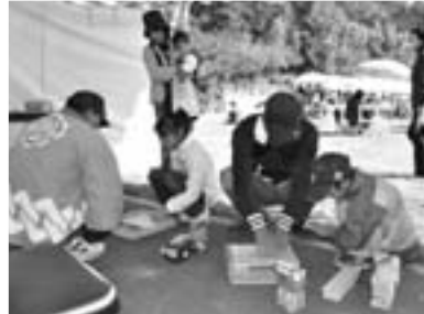
ちびっ子木工広場