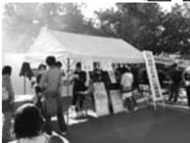
消防ふれあい広場