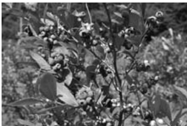
ブルーベリーで農業体験