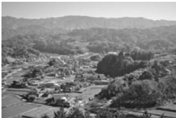
城山公園から望む富田地区