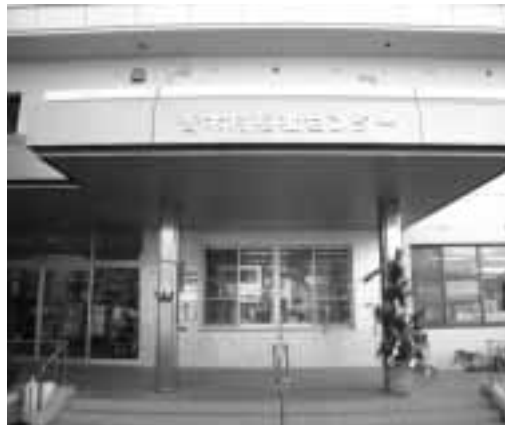
新名称を掲げた福祉センター玄関

昨年一〇月に改修工事が完成した老人福祉センターですが、施設の利用形態を考慮し、乳幼児から高齢者まで、公民館活動などを通して広く村民に利用される施設であることから施設名から「老人」という名称を削除し、新しく「喬木村福祉センター」という名称に変更しました。