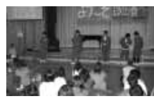
おわりの会の感想発表