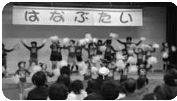
老人福祉センター大規模改修が完成し、総合文化祭ではなぶたいが行なわれました

占める中で、新年度予算について厳しい状況が想定されますが、七、〇〇〇人規模の村づくりを目標に、みんな考えて行動する、協働の村づくりを基本に進めてまいります。そこで、次の五項目を重点政策として位置づけました。