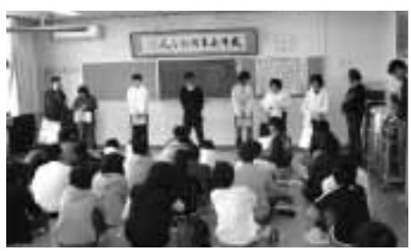
実習オリエンテーション

11月に校外実習を行いました。それぞれ、事業所や企業に行き、2、3週間働きました。卒業後の生活を想像しながら何が大切かを考えました。社会の厳しさなどいろいろな経験ができました。