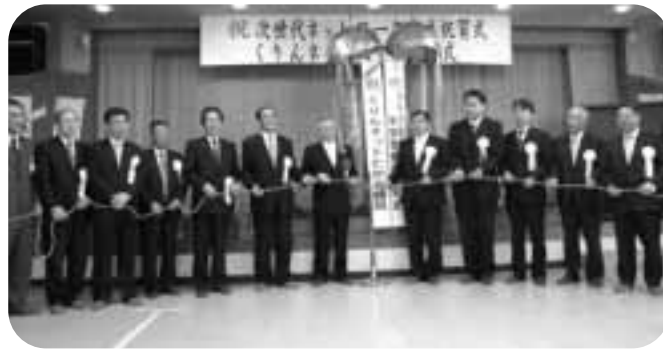
次世代ネットワーク竣工式とくりんネットたかぎの開局式が行なわれました