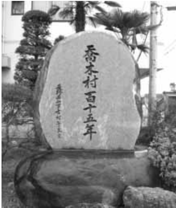
20年前に建てられた喬木村115年記念碑

編集 企画財政室／発行 喬木村役場 TEL 0265-33-2001 FAX 0265-33-3679 印刷 龍共印刷株式会社 (飯田市上郷黒田121-1)