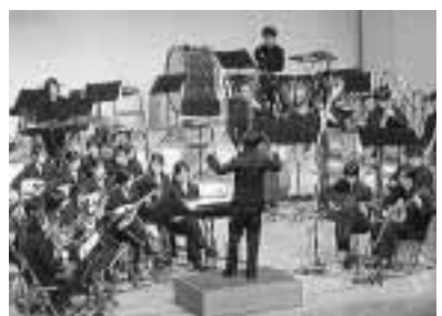
記念コンサートでは明大マンドリン倶楽部の演奏を予定

駆けめぐって、経済不況が国民生活を襲っています。この様な時にこそ、視野を広くして、将来を見つめる良い機会ではないでしょうか。村ではこの記念事業が一部の関係者だけの取り組みでなく、全村民を巻き込んだ取り組みになるようにと、実行委員会を立ち上げ事業内容について検討を重ねてきました。あまり華美にならないなかでも、村民の皆さんが元氣の出るような取り組み、将来に繋がるような取り組みを行っていく計画です。一応、記念式典とコンサートは九月二十六日を予定しています。その他の具体的な事業内容は次回にお知らせいたします。