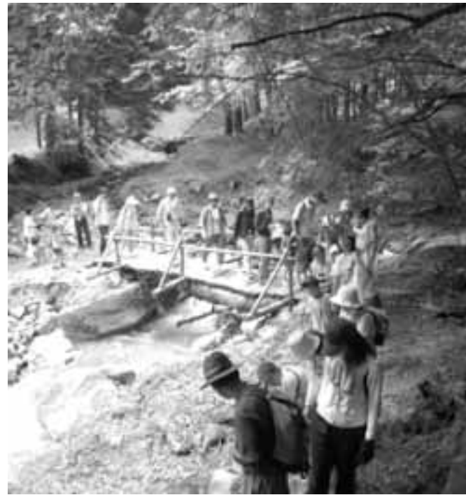
山間集落では地域資源を活用した各種事業が展開されています

限界集落という言葉をご存じですか。最近新聞やテレビにしばしば登場する言葉です。限界集落は、六五歳以上の高齢者人口が住民の五〇%を越えた集落のことで、中山間地を中心に日本中に二、五〇〇集落程度存在するといわれています。こうした集落では急速な高齢化のため、道路や水路の維持や祭の継承など、共