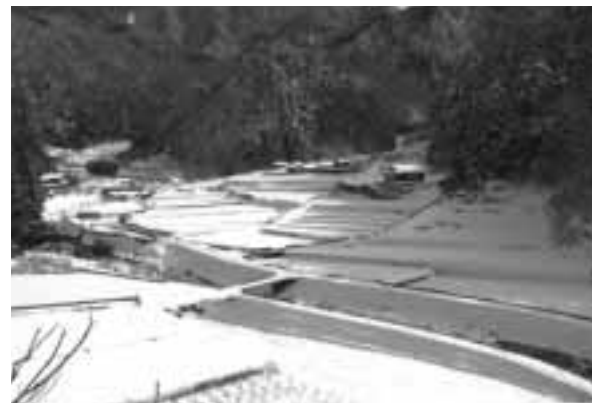
幹線道以外の集落内道路の除雪対応なども検討が必要です

す。地域のまとまりという点では、他の地区より強く住民同士が結ばれていると言えます。地域の課題に対し、地域資源を有効に活用し、他地区から多くの交流者を迎えることなどで地域のにぎわいを取り戻し、その地域に生きる活力にしようとする取り組みは、山間地の集落ほど積極的だと思われまます。現在、各地区の事業計画策定が進められています。五年後、一〇年後の地区を支える世代がどの様な状況になっているかを慎重に