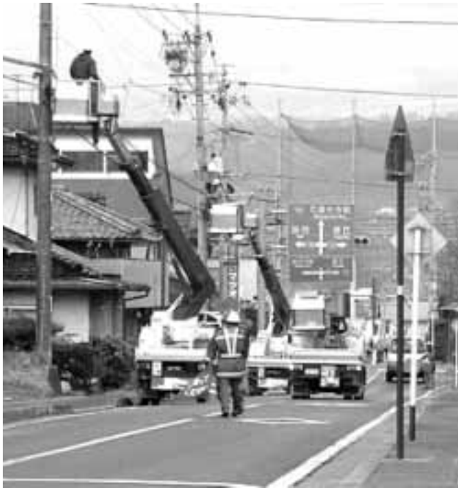
光ケーブル幹線工事が進められています

編集 企画財政室／発行 喬木村役場 TEL 0265-33-2001 FAX 0265-33-3679 印刷 龍共印刷株式会社 (飯田市上郷黒田121-1)