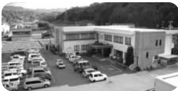
新年度に取り組む老人福祉センターの大規模改修

に降りかかり、生産地としての生き残りに大変な事態を招いています。何とか価格が低下してほしいと願っています。