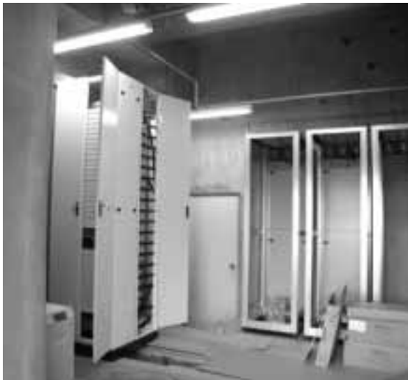
老人福祉センターに設置が進む発信装置

来年一月からはいよいよ宅内工事が開始されます。宅内工事に先立ち、指定工事店により事前調査が開始されていますので、工事やデジタル放送などについて解らないことは指定工事店にお聞き下さい。