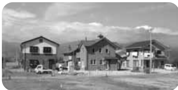
7,000人の村づくりに向け、中原第2住宅団地を分譲