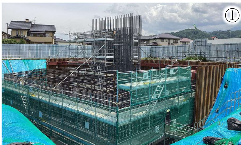
竜東一貫道路東側の様子

※本線工事のヤード等として、一部の土地を借地して使用させていただきたいと考えております。ご協力いただきたい方にはご相談に伺います。