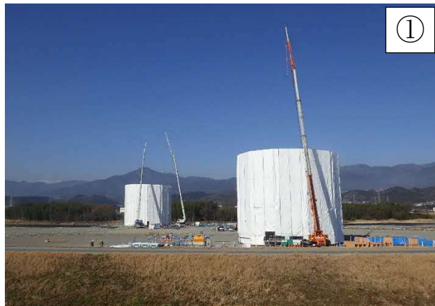
河川内の橋脚工事

※本線工事のヤード等として、一部の土地を借地して使用させていただきたいと考えております。ご協力いただきたい方にはご相談に伺います。