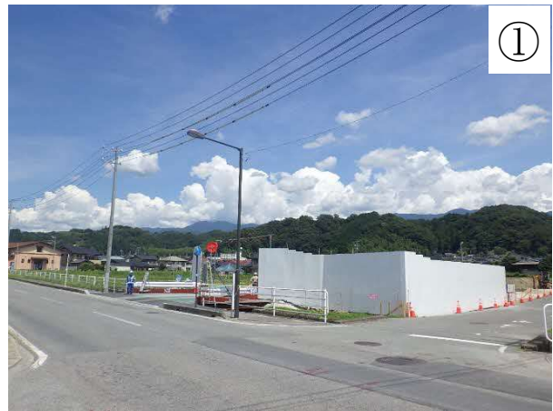
高架橋施工ヤード整備工