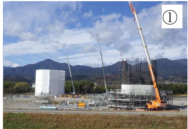
河川内の橋脚工事

※本線工事のヤード等として、一部の土地を借地して使用させていただきたいと考えております。ご協力いただきたい方にはご相談に伺います。