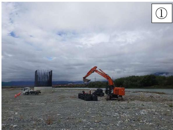
築島施工ヤード整備工

※本線工事のヤード等として、一部の土地を借地して使用させていただきたいと考えております。ご協力いただきたい方にはご相談に伺います。