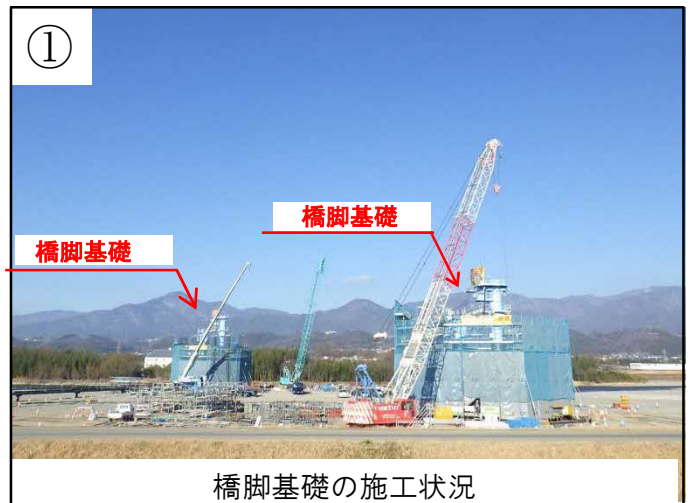
橋脚基礎の施工状況

○2月の天竜川河川内の工事は、工期に余裕が無いため日曜日に作業を行わせていただきたいと思いますと考えております。日曜日の作業では耕土搬出やコンクリート打設などの工事用車両が多く出入りする作業は行いませんので、ご協力をお願いいたします。