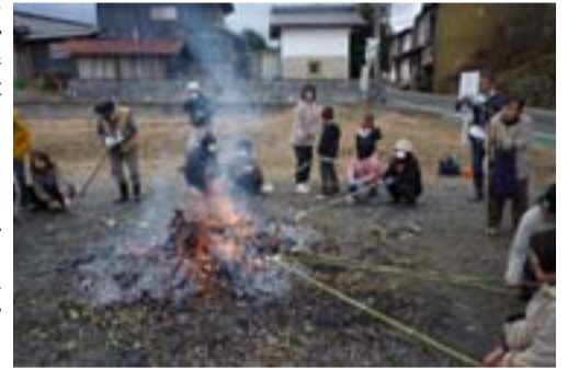
撮影：喬木カメラクラブ 飯島 誠さん (富田)

「知り合い、ふ れあい、学び合 う」生涯学習の 実践や環境づく りなどの様々な 活動や学習会を 行っていたたい ています。特に 昨年は、絆の大 切さが問われ、 家族や社会の結 びつきが見直さ れた年でもあり