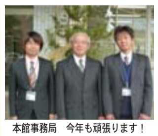
本館事務局 今年も頑張ります！